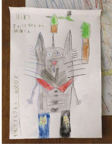
Fest des Kinderbuchs 2022