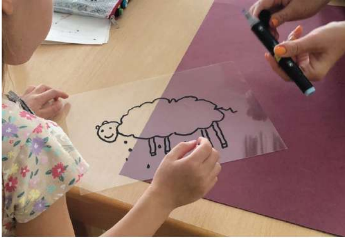
Fest des Kinderbuchs 2022