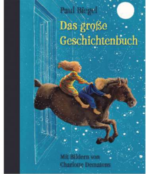
Charlotte Dematons, Illustration

mit Serviettenmotiven, Blüten oder Blättern verziert und anschließend trockengebügelt. Geübte Hände zaubern auch Wasserstempel, mehrfarbiges Papier und bunte Muster. Ab 5 Jahren. Dauer: durchgehend