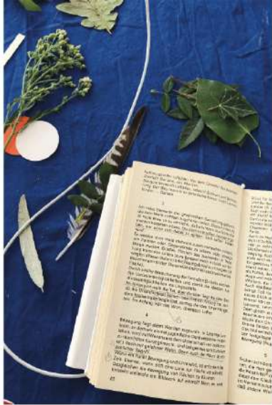
Fest des Kinderbuchs 2022