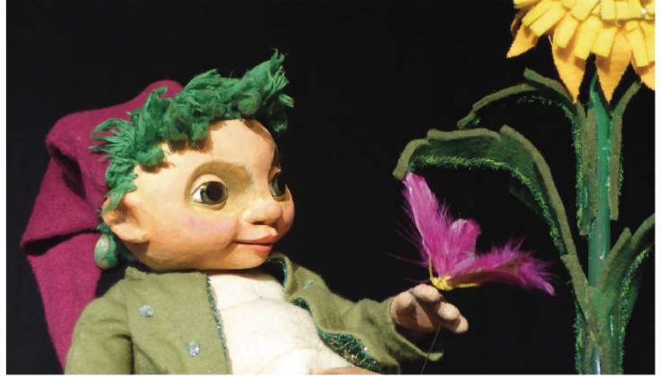
Bielefelder Puppenspiele, Der kleine Wassermann

17.30 Uhr, musikalisches fröhliches Finale des Kinderbuchfestes